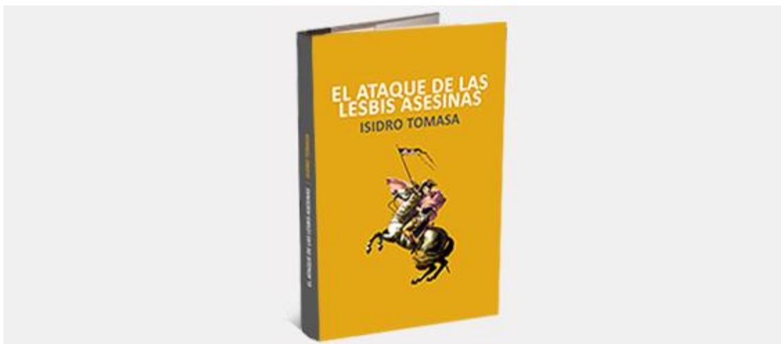
El ataque de las lesbis asesinas, el libro que ha destapado la infamia lesbirusa

¿No habías oído hablar nunca de los crímenes del lesbianicrato ruso? No te extrañes: el GMIL dispone de una extensa red de lesbianas asesinas cobijadas en las más altas instancias del poder en la Tierra. Desde hace decenios, estas abanderadas de la causa rollo-bollo intergaláctica se dedican a tergiversar la historia y esconder el genocidio ocurrido en el siglo XVIII. Pero sus malvados anhelos no han conseguido evitar la publicación de “ El ataque de las lesbis asesinas ”, un libro que bajo la aparente forma de una novela sucia, irreverente, insultante, malvada y procelosa desvela toda la verdad sobre los crímenes del lesbianicrato y sobre el mal que se esconde en Europa, segunda luna de Júpiter.